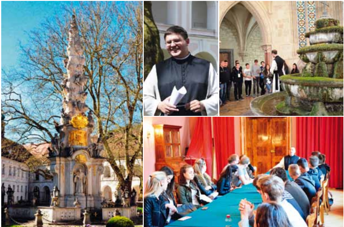
Schatzsuche: Gespräche mit jungen Mönchen im Innenhof und in den Räumlichkeiten des Klosters