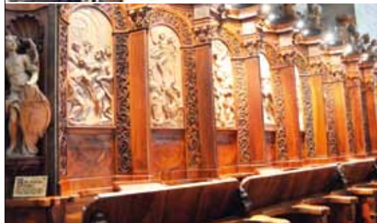
Oben: Mittagessen im Innenhof Unten: Holzrelief im Chorgestühl der Stiftskirche

neue per Hand gefertigt wurden. Auch die neu ausgebaute Ordenshochschule samt modernem Radio- und Fernsehstudio war Abbild vom regen klösterlichen Alltag. Andere Gruppen sammelten sich an ruhigen Orten, um sich mit einem Ordensmann über Leben, Berufung, Glück und Sehnsucht – Gott und die (ver-rückte) Welt – auszutauschen und dabei neue Perspektiven für sich zu entdecken. Es war ein reichhaltiges und abwechslungsreiches Menü, wo auch reines Entspannen – oder jugendlich gesagt: Chillen – seinen Platz finden sollte.